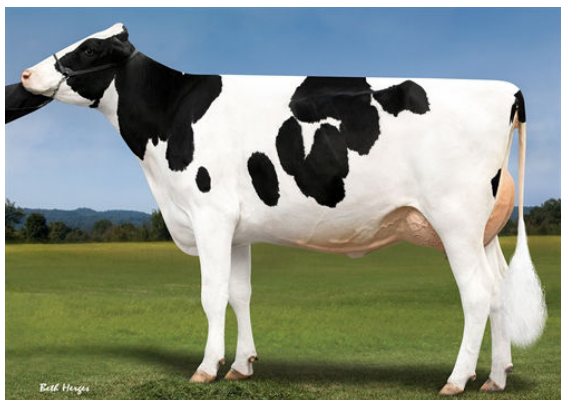
PROGENESIS DUKE MOLDAVITE GRANDDAM